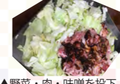
▲野菜・肉・味噌を投下

三重県亀山市にある亀とん食堂に行ってきました。B 級グルメの味噌焼きうどんで有名なお店です。店内に入ると怖そうな店長と思いきおっちゃんが登場。とりあえず、席についてドリンクを頼むと「無理して飲まんでえ！この無料の烏龍茶で十分やろ」と一言。ん？牛と豚を頼むと「味がおかしくなるのでどっちかにしてや」とまたバツサリ。完全に頑固なおっちゃんのペースで、なんとかテーブルに大量のキャベツと肉が到着。アツアツの鉄板に具材を入れるとまたもおっちゃんが登場。「早よ混ぜなはれ！コゲるで！下手クソやな」と言いつつも混ぜ方を教えてくれたり、火力を調節してくれたり。結局出来上がるまで、ひたすら具材をかき混ぜました。ようやく出来上がった味噌焼きうどん、めちゃくちゃうまい！完全におっちゃん味噌焼きうどんの虜になってしまいました。2 日連続で通っちゃいました。オススメは、ご飯の上に乗った味噌焼きうどんを乗せる食べ方です。11 月の現場帰りにまた行けるといいな…。皆さんも亀山に立ち寄った際は是非一度はご賞味あれ。