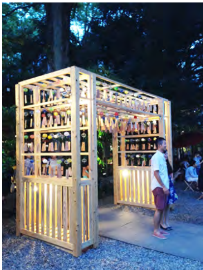
風鈴回廊への入口（撮影スポット）