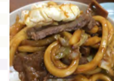
▲おすすめの食べ方 ご飯 on 味噌焼きうどん