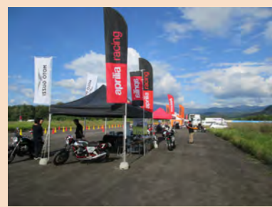
BikeJIN 祭り北海道 (本番当日)