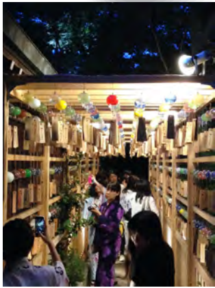
縁むすび風鈴回廊