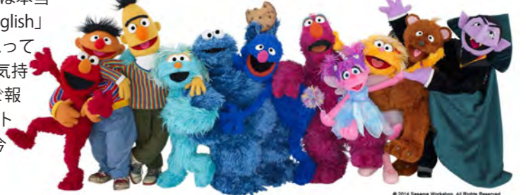
© 2014 Sesame Workshop. All Rights Reserved.