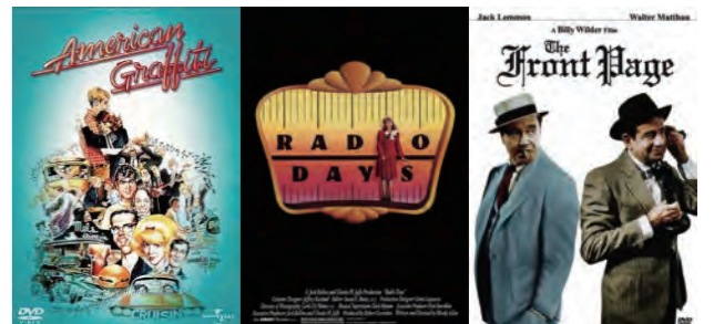
秋の夜長は、好きな映画とともに過ごしましょう。

因みにエンディングに、登場人物のその後の消息を紹介するのは、この映画が最初とされています。その後ぼくの大好きなビリー・ワイルダーが傑作「フロント・ページ」でこの演出を用い、ジョージ・ルーカスに「いただいた」と公言し、それ以降すっかり映画の 1 パターンとして定着しました。ジョージ・ルーカスも、なかなかのものですね、でもそれはまた別の話。(これは、ビリー・ワイルダーが老舗)。それでは次号、Ciao!