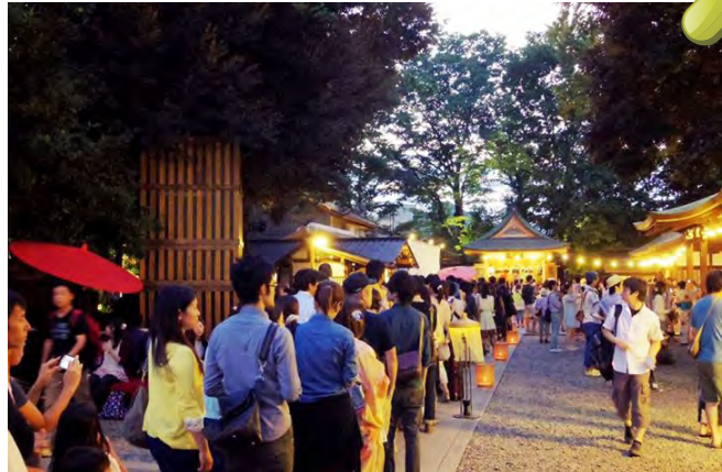
風鈴回廊へ向かう長蛇の列