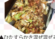
▲ひたすらかき混ぜ混ぜる