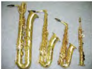
▲左から2番目がテナーサクソ 3番目がアルトサクソ