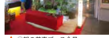
▲①朝の茶事ブース全景