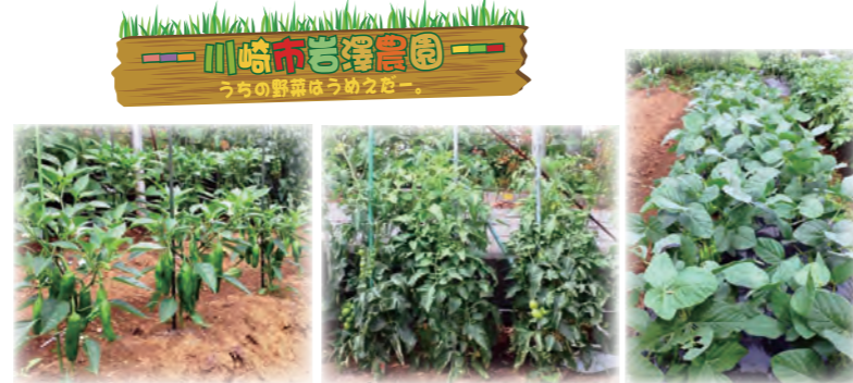
現在、ししとう・ピーマン・ナス・トマト成長中！ 枝も成長中！

帰りは、約26km・約25分を車で走り、圏央道「木更津東IC」からアクアラインで帰りました。私は、5月に行きましたが、秋紅葉の時期に行く事をオススメします！