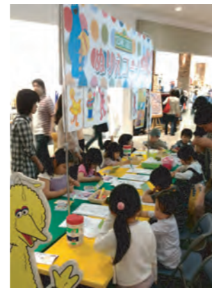
TM and © 2012 Sesame Workshop. All Rights Reserved.