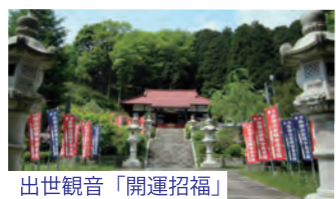
出世観音「開運招福」

もうひとつ、6km車で移動したところに滝めぐりの粟又遊歩道コースもあります。幻の滝・昇龍の滝・見返りの滝・萬代の滝・千代の滝・粟又の滝など、大小さまざまな滝あり、岩つづいで有名な水月寺あり、子宝のみみじあり。ゆ〜っくりと歩くと、1周約2時間です。