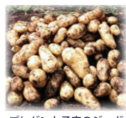
プレゼント予定のジャガイモも無事に収穫！