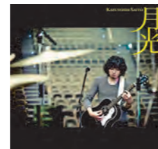
因みに今をときめく斉藤和義の「月光」は久々にロックしていて心地よいです