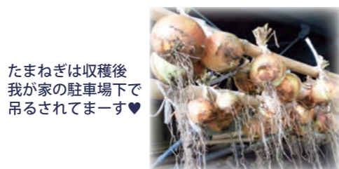
たまねぎは収穫後我が家の駐車場で吊るされてます♥