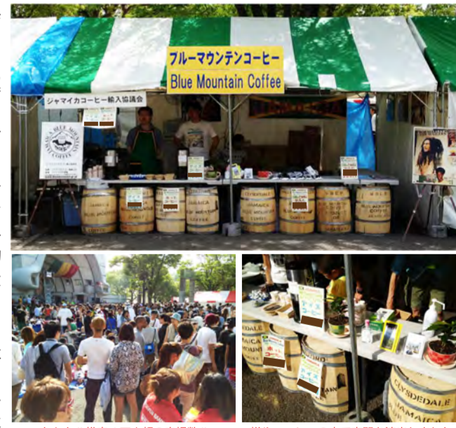
なんと！！推定4万人の来場数！！ 樽やコーヒーの木で空間を演出しました！！

僕は先日、代々木公園で開催されたレゲエの祭典「ONE LOVE JAMAICA FESTIVAL 2013」内でブルーマウンテンコーヒーのプロモーションの一環として、ジャマイカコーヒー輸入協議会様のブース運営・売り上げの管理を担当させて頂きました。ブースでは、コーヒーの提供・挽き豆の販売を行いました。イベント当日は両日とも晴れ、たくさんのお客様が来場していただき、結果としてすべて完売することができました。ありがとうございました！！僕は、今回のイベントで改めて、来場されるお客様や各社のご担当の方の笑顔と言葉は、働く上での元気の源、つまり僕にとってはとても大事なガソリンであると感じました。お客様がコーヒーを飲んだあとに言ってくださる「おいしい！！」の一言、そしてその一言を聞いて笑顔になる各社のご担当の方の表情を真近で見れば見るほど、この業界に入って良かったと強く思ひます。これからはたくさんの方の笑顔を引き出せるような仕事をしていきたいと思ひます！！