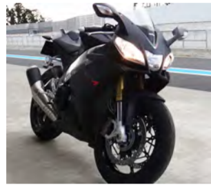
←aprilia RS-V4 R APRC ABS

私はまだ、教室に通っているのですが、バイクはおろか車さえも運転できないのですが「ヤ、ヤベー！カッター！」と思ひて、とても気に入っているバイクです。いきなり自分の事を書いてすみません。でも、大学卒業まで、バイクに触れたことがなかった私が、入社してすぐに、バイクイベントに携わるとは思ひもしませんでした。しかも、サーキットで！