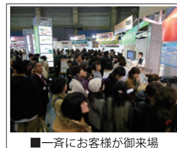
■一斉にお客様が御来場