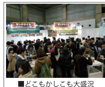
■どこもかしこも大盛況

さすがに広い会場内を歩き回り、気が抜けない状態が続くと心身ともにヘトヘトに。そんな時、1人の清掃員のおじさんが「一緒に手伝ってくれてありがとうね。」と一言。くしゃくしゃの笑顔で私に声をかけてくださいました。その言葉が嬉しくて、もっとその気持ちに伝えたいと強く思いました。その後、苦しくなった時にはお互いに声を掛け合い、情報の共有や現状の報告などをこまめに取り合うようになりました。最初はただやみくもに歩き回っていた会場も、優先すべき場所をピンポイントで見れるようになり、業務効率も一気に上がりました。私が今回携われたことは本当に小さなことでしたが、この小さな一つ一つを積み重ね、まとめることが運営ということ。そして運営するにあたり、如何に言葉で気持ちを伝えることがより良い物を作る上で重要である。改めて実感し、残り3会場をさらに盛り上げていこうと身の引き締まる思いがした、そんな岡山でした。