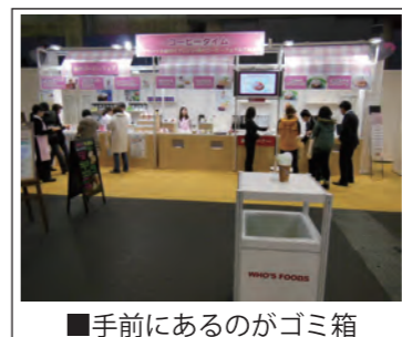
■手前にあるのがゴミ箱

言葉で気持ちを伝えるということ。歳を重ねる度にコミュニケーションツールが多様化していく中で、その難しさや複雑さが増している事を感じ、苦悩する今日この頃。まさに、歳月人を待たず。現在、岡山を皮切りに大阪、名古屋、東京の全4会場で行われる、ユーシーシーフーズ株式会社様主催の「WHO'S FOODS 2013」の制作・運営に携わっております。先日の岡山会場において、私は業務の一つといたしまして、会場内のゴミ処理の管理を任せられました。ほとんどのブースが試食・試飲を行っているので、ピーク時には溢れ出る状況。それを3人の清掃員のおじさんの力を借りながら、お客様のお食事の気分を害することのないよう処理をしていたわけですが・・・