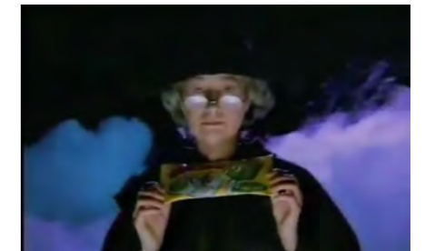
昔、大興奮した『ねる〇〇ねるね』