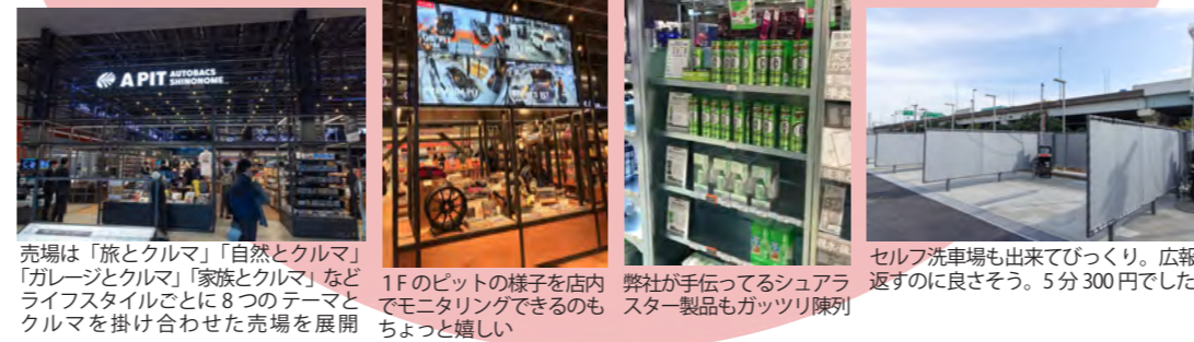
売場は「旅とクルマ」「自然とクルマ」「ガレージとクルマ」「家族とクルマ」などライフスタイルごとに8つのテーマとクルマを掛け合わせた売場を展開

クルマを運転しない人はあまりご存知ないかもしれませんが、オートバックスのフラッグシップ店である「スーパーオートバックス東京ベイ東雲」が7月31日に突如閉店し、11月末まで工事となり、クルマやバイク系のJobが多い私にとってはかなり不便であった。やっと先日11/29(金)に「A PIT AUTOBACS SHINONOME」としてリニューアルオープンした。工事中に関係者からリニューアルの内容について聞いていたのは、オートバックスとTSUTAYA BOOKSTORE とスタバが融合した、ドライバーだけでなく、そのクルマに乗る家族も一緒になって楽しめるお店。それが新しく誕生した「A PIT AUTOBACS SHINONOME」のコンセプト。クルマに対する価値観が多様化する中、顧客1人ひとり「あなた」にとっての「PIT」サービスの提供を目指すということからA PIT (あびつと) とのこと。お店は圧倒的にクルマ関係の商品数は少なくなったが、オートバックスがそこへシフトしたのは、オートバックスの持つ1,500万人の顧客基盤およびカーライフのノウハウと、CCCグループが有する6,800万人の顧客基盤およびライフスタイル提案力といった両社のリソースを連携して、カーライフを軸としたデータベースサービスの構築とマーケティングサービスを行っていくことを両社で握った模様。そう思うとクルマも、もっと楽しいものになりそう。