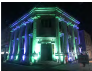
商工会議所ライトアップ

11 月 4 日~5 日、川越の大正浪漫夢通りを中心としたイベントが実施されました。毎年、商工会議所のライトアップのお手伝いさせて頂いているのですが、今年は夏頃に相談があり、大正浪漫通りの演出と蓮馨寺のステージ、そして毎年の商工会議所のライトアップと 3 か所に拡大。このイベントは、毎年、地元の有志が集って準備しているイベント。しかし、それぞれの本業の合間を縫って、ボランティアでイベントの準備はかなりの労力と負担。6 年間やっていた青年会の方々が、今年は難しいとのこと。これが、地方で実施する町おこしの難いところ。1 年目~2 年目は、勢いよくできるのですが、その後継続していくことが負担になります。ということで、川越市観光協会より相談がありお手伝いすることに…。限られた予算の中で、実現可能なことを考えた末に、大正浪漫通りに 11 台のムービングライトを設置し、ライト GOBO (ライトで演出できる模様) を利用して、ストリートにライトアップ演出を施しました。とはいえ、予算が厳しいので照明さんにご協力を仰ぎながら、なんとか実施することができました。写真がその設営風景とライトアップの様子です。本当は、もっといろいろ“やってみたい”という思いと、商店街の皆さんも“やりたい”という思いとは別に、できることでの現実の狭間で実施しました。照明会社のライズさん達は、夜中まで設置とシュートに付き合ってくれました。ありがとうございました。また、来年もお手伝いすることがあれば、今年の内容より少しでもいいので、プラスに事を付け加えて協力できればと思います。毎年、少しずつプラスを増やすことで長く続くイベントになればと思います。