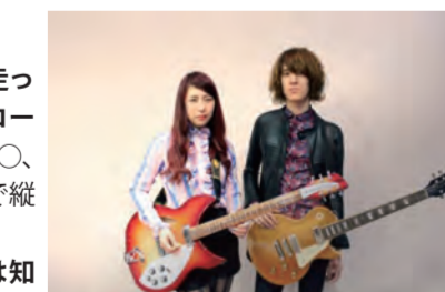
懐かしくて新しいサウンド