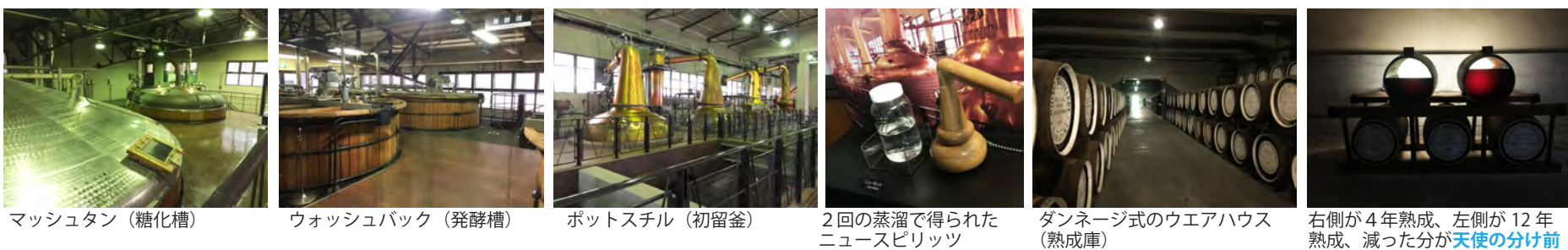
マッシュタン(糖化槽) ウォッシュバック(発酵槽) ポットスチル(初留釜) 2回の蒸溜で得られたニュースピリッツ ダンネージ式のウエアハウス(熟成庫) 右側が4年熟成、左側が12年熟成、減った分が天使の分け前

このように、熟成期間中に蒸発するウイスキーのことを「天使の分け前」と呼びます。(つづく)