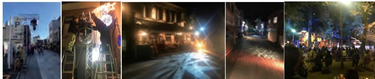
設置したムービングライト。カプセルは、ムービング用の雨除け。

11 月 4 日~5 日、川越の大正浪漫夢通りを中心としたイベントが実施されました。毎年、商工会議所のライトアップのお手伝いさせて頂いているのですが、今年は夏頃に相談があり、大正浪漫通りの演出と蓮馨寺のステージ、そして毎年の商工会議所のライトアップと 3 か所に拡大。このイベントは、毎年、地元の有志が集って準備しているイベント。しかし、それぞれの本業の合間を縫って、ボランティアでイベントの準備はかなりの労力と負担。6 年間やっていた青年会の方々が、今年は難しいとのこと。これが、地方で実施する町おこしの難いところ。1 年目~2 年目は、勢いよくできるのですが、その後継続していくことが負担になります。ということで、川越市観光協会より相談がありお手伝いすることに…。限られた予算の中で、実現可能なことを考えた末に、大正浪漫通りに 11 台のムービングライトを設置し、ライト GOBO (ライトで演出できる模様) を利用して、ストリートにライトアップ演出を施しました。とはいえ、予算が厳しいので照明さんにご協力を仰ぎながら、なんとか実施することができました。写真がその設営風景とライトアップの様子です。本当は、もっといろいろ“やってみたい”という思いと、商店街の皆さんも“やりたい”という思いとは別に、できることでの現実の狭間で実施しました。照明会社のライズさん達は、夜中まで設置とシュートに付き合ってくれました。ありがとうございました。また、来年もお手伝いすることがあれば、今年の内容より少しでもいいので、プラスに事を付け加えて協力できればと思います。毎年、少しずつプラスを増やすことで長く続くイベントになればと思います。