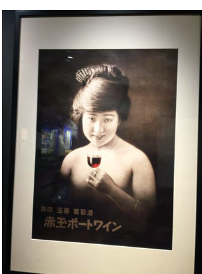
【写真】上：山崎蒸溜所入口の建物 下：赤玉ポートワインのポスター

このように、熟成期間中に蒸発するウイスキーのことを「天使の分け前」と呼びます。(つづく)