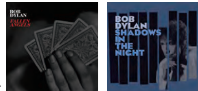
近年はスタンダードナンバーを歌いまくっています。カラオケというより鼻歌。ディランと温泉に入った気分