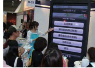
▲巨大スマートフォンで実演中。

JAF ブースに巨大スマートフォンが出現しました!! ご紹介しているのは無料スマートフォンアプリ「JAF お得ナビ」です。JAF 会員はその会員証を提示するだけで全国 26,000 か所以上の提携施設で会員優待を受けられるんです! その提携施設がいつでもどこでも検索できるアプリ「JAF お得ナビ」をクイズ形式でご紹介しました。1 小間のブースに入れたモニターサイズはなんと 85V 型! 遠くからでもよく目立つインパクトあるブースになりました。MC の手元のスマートフォンの操作がそのまま巨大画面に反映される仕組みでステージでアプリを紹介し、多くの方にご参加いただきました。11月の旅フェア@池袋サンシャインでも登場予定!