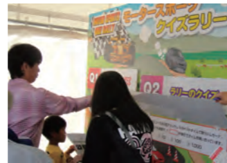
▲バカバカとめくる仕様のクイズラリーで楽しみながら参加いただけます。

都内でおこなわれる最大のモータースポーツイベント「モータースポーツジャパン2012」。今年も JAF ブースの担当をさせていただきました! JAF とモータースポーツの関わりはというと...国内四輪モータースポーツのライセンス発給をおこなっているのが JAF。モータースポーツに参加している数々の有名選手も JAF 会員ということです! そんな JAF がより多くの人にモータースポーツに親しんでもらおうと来場者参加型のコンテンツでブース展開をおこないました。耳で聞くだけ、目で見ただけでなく「参加・体験」いただくことで、効果的に認知してもらえる展開を意識しました! しかも...モータースポーツ選手は特別なんで思っている方も多いですが、カートライセンスなら 10 歳から取得でき、B ライセンスは 2 時間の講習で取得が可能です! 意外と身近に感じませんか! 次回は 11 月中旬に富士スピードウェイで開催される JAF グランプリ! JAF の魅力を精一杯 PR していきます!