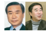
ハルキ顔のヒトビト 羽田孜と川本三郎