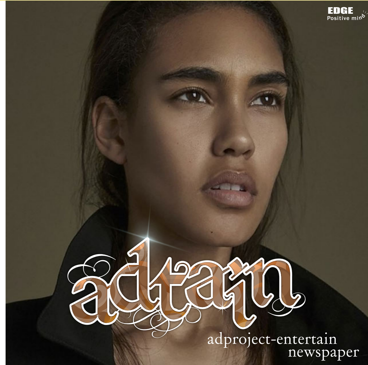
モデル：CHINA / Height:175cm B:82 W:61 H:90 事務所：ARTRICK ENTERTAINMENT (アートリック) http://artrick.com

世界のパラダイムが「美しいもの」、「楽しいもの」へと変化することによって、文化は「子供化」します。「子供化」とは、例え