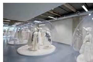
海外事例② ▶ アパレル展示会 バブルツリーの中に入れるだけでスタイリッシュな展示が可能