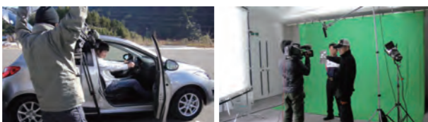
↑ふんわりアクセル実践。↑グリーンバックで撮影中。

エコドライブポータルサイト・レクーメディア ReCoo Media Reduce CO2