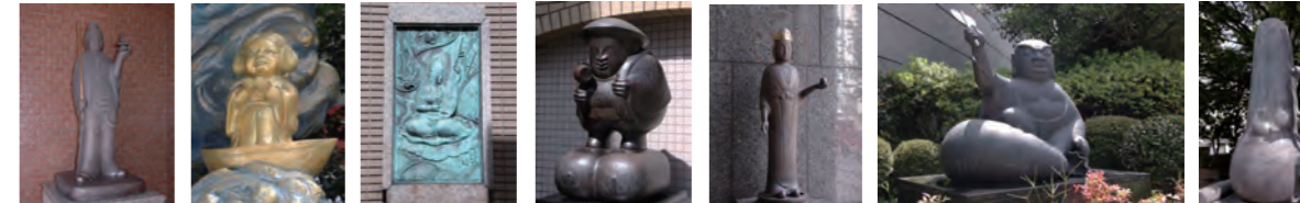
神田駿河台 毘沙門天 神田明神 恵比須 外神田 弁才天 神田佐久間河岸 大黒天 神田須田町 吉祥天 神田駿河台 布袋 九段北 寿老人

なんと!弊社が拠点を構える千代田区にもユニークな七福神を発見!! → その名も「神田アート七福神」!!! (福祿寿が吉祥天という女神になっている変則的構成の七福神)