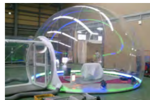
工場での仮組の様子 中に照明を入れて照明のテスト中。ムーディーな照明演出も可能