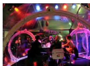
海外事例① ▶ ラジオスタジオ 大きな音を出しても外にはほとんど漏れない不思議な空間

今回バブルツリーを探している過程で、海外のプロモーションや日本では見たことのないアイテムを多数知る機会があり、ユニークな発想力に刺激を受けました。その反面、海外との取引の際は相手(国)企業のwork styleと輸入申請に要する時間を考慮して、十分な余裕をもって取引することが重要だと改めて感じました。今回の輸入手配で学んだことを活かし、今後海外モノのご提案もどんどんしていきたいと思っています!!バブルツリーに興味を持って頂いた方また、日本初やユニークで他社と差別化の図れる楽しいことをしたいとお考えの方は、ぜひ第3プロジェクトへご相談下さい!!