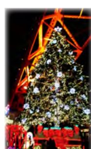
東京タワー下のツリー♥