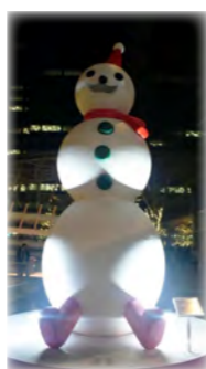
しゃべるスノーマン♪

六本木ミッドタウンにかわいいクリスマス・サンタツリーがありました。よく見るとひとつひとつが違うサンタで構成されていました。