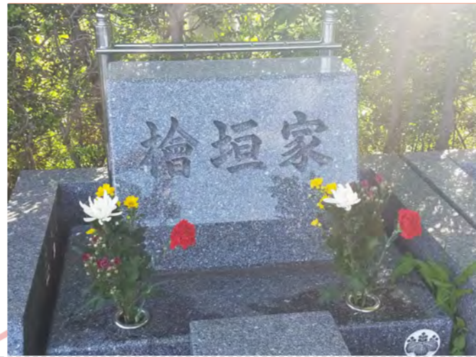
所沢聖地霊園 74区 14列 5番