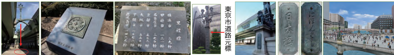
② ③ ④ ⑤ ⑥ ⑦

先月号で、岩澤はやとが日本橋で行われた「ジャパン・クラシック・オートモービル」について記事を書かせていただきましたが、それに携っていた私が、多分皆さんあまり知らないであろう日本橋車道中央にある「道路元標」について書かせて頂きます。普段は車道へ降りることが出来ないで、年に数回しか拝むことが出来ませんが、このイベント時は車道封鎖のため観ることが出来るのです。そもそも「道路元標」ってナニ？という方へ。正式名称は「日本国道路元標」。日本橋の歴史は1603年徳川家康の命により架けられました(415年前)。そして五街道(東海道・中山道・甲州街道・日光街道・奥州街道)の原点として定められ、ここから日本の道の起点としての役割が始まりました。今、日本中にある“東京へは何キロ”の標識は日本橋を指しています。現在の国道では7つ。国道1号(～大阪府大阪市)806.6km。国道4号(～青森県青森市)887.1kmは日本一長い国道。国道6号(～宮城県仙台市)442.7km。国道14号(～千葉県千葉市)65.0km。国道15号(～神奈川県横浜市)29.6km。国道17号(～新潟県新潟市)461.9km。国道20号(～長野県塩尻市)233.2km。ちなみにサイズは50cm角で、元標のプレート文字は「佐藤栄作元総理大臣」によって揮毫されたものだそうです(写真①)。この元標の場所を示す表示がこのモニュメントであり、その真下に元標が設置されています(写真②)。車道に降りれないため、その複製が日本橋北詰(三越側)の「元標の広場」に設置されています(写真③)。同様に各地まで何キロの「里程標」も隣にあります(写真④)。また各都道府県に存在する各地の道路元標東京版が「東京市道路元標」として設置されています(写真⑤)。北詰と南詰に1つずつ「日本橋」という銘板がありますが、これは江戸幕府最後の将軍、徳川15代「徳川慶喜」によって書かれた文字だそうです(写真⑥)。現在の橋は1911年に完成し「関東大震災」「東京大空襲」も潜り抜け、100年を超える歴史を有しています。最後に上を通る首都高速が取除かれた未来の日本橋のイメージパースを見つけてました。日本を象徴する日本橋はこうありたいですね(写真⑦)。時間があつたら是非、日本橋を散策し過去と未来を夢見てはいかがでしょうか。