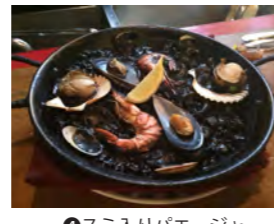
④スミ入りパエージャ