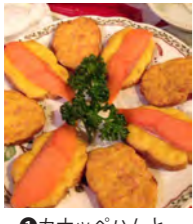
①カナッペハムとカナッペサーモン