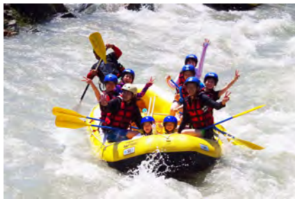
荒川ラフティング