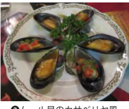
②ムール貝のカサベリヤ風