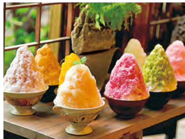
阿佐美冷蔵のかき氷

今回は、生まれも育ちも埼玉県の私が、埼玉県秩父周辺を観光してきましたので少し紹介したいと思います。昔はあまり知られていなかった秩父ですが、最近では、行列のできる人気店、天然の水で作られる「阿佐美冷蔵のかき氷」を求め、多くの観光客が秩父へ足を運ぶようになったと思います。阿佐美冷蔵のかき氷は、TV「マツコの知らない世界」でも取り上げられ、平日休日問わず連日行列となっています。繁忙期では3時間待ちもしばしばあるようです。天然氷を使っているのかき氷特有の頭がキーンとなることなくと言われておりますが、私はキーンとなりましたw 秩父の魅力はまだたくさんあります。次にご紹介するのは、ダイナミックな自然のスクリーンを眺めながら荒川を豪快にすべるライン下りです。国の特別天然記念物に指定されている長瀬の岩畳をゆっくり堪能しながら、季節に合わせて大自然を楽しむことができます(ちなみに冬はこたつ付きの船があるみたいです)。他にも、ラフティングやカヌーが体験でき、その日の水量によって川の流れるのが違うので毎日違った楽しみ方ができます。私が昨年ラフティングをした日は、台風が過ぎた翌日だったため、川の流れるのが早くて水量が多かったので途中ボートが転覆し、乗客全員が流されるといったハプニングもありましたが、すぐに周りのボートが助けに来てくれて無事帰ってこれることができました。一度流されてみたいという方には、台風の翌日はオススメかもしれませんw その他にも、秩父周辺には自然を楽しめるコンテンツが盛りだくさん！「羊山公園の芝桜」「長瀬渓谷」「三十槌の氷柱」などなど、季節ごとに楽しみ方が変わるのも魅力的です。仕事で疲れを感じている方や、羽を伸ばしたいと思っいる方々！是非、秩父へ足を運んでみてはいかがでしょうか。