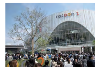
グランドオープン初日

久しぶりにシゴトの話題。こう見えても、たまには働いているんですよ(笑) 以前拙文でご案内したように、10年前の開業以来、弊社が仮眠イベントに携わらせていただいております片倉工業株式会社様の商業施設「コクーン新都心」が、新たに「コクーン2」を開業し、この4月24日「コクーンシティ」としてグランドオープンいたしました。コクーンシティの公式facebookによると、グランドオープン初日は、10万人を超えるお客様がご来場とのこと。そして同施設内の弊社のお取引先様の「メロウ・ブラウン・コーヒー」「シナボン」には連日長蛇の列が！パチパチパチ。そのほか、ハワイ発話題のパンケーキや、コペンハーゲンのリーズナブルな雑貨なども大人気。なにせ164店舗を有しているだけに、まだまだ楽しみはつきません。さてそんな「コクーンシティ」のシンボルともいえる「コクーンひろば」には、常設のイベントステージが完備。いよいよここから弊社の出番。オープン2日目、25日にイベントステージのこけら落としを飾ったのは、CHEMISTRYの堂珍嘉邦さん。ソロ活動中の堂珍さんは、「ドミノ」のようなトニックコード(主和音)ではなく「ドミソシ」といったメジャーセブコードを多用したアコースティックサウンド。一言でいうと、ゆったりとして幻想的な耳触りのサウンド。中でも極め付けは「a Day in the Life」。レノン&マッカートニーとクレジットされているものの、実は単独作が多いビートルズの楽曲の中で、真のジョンとポールとの合作といえるこの難曲を、原曲のサイケデリックな魅力を醸し出しつつ、自分の節で見事に歌い上げました。(なんか根本朋子のページみたいになってきた)そして第2弾の29日は、Ms.OOJA。彼女はリスナーにヒーリング効果を与える声と言われている「1/Fのゆらぎ」のシルキーボイスの歌声の持ち主として人気急上昇中です。オリジナル曲に加え、大ヒットのカバーシリーズから、ELTの「Time Goes By」を熱唱。彼女は本当に歌が上手い。構成上4曲のライブでしたがお客様は(そしてぼくたちも)大満足。それにしても上手い人の歌声は、お腹がいっぱいになるから不思議ですね。そして5月の5連休は「Surpriseパフォーマンス!!」の5日間を展開しました。スタチュー(人間銅像)、足長芸、フランス直輸入の手廻しオルガンなど、拘りの芸人をキャスティングしたものの、お客様を中心に根強い人気は、やはりクラウン。悲しくて可笑しいクラウン。子供の友達クラウン。企画屋としては(あれ、そうだったんかい!) ついつい新しいソフトを探索し、慣れ親しんだソフトを蔑ろにしてしまいがちですが、お客様は代替わりしていきます。ターゲットに即した本物のソフトの魅力は、普遍の力があると言えるかもしれない、なんて柄にもなく真面目なことを考えてしまった5月のさいたま新都心でした。では次号、Ciao