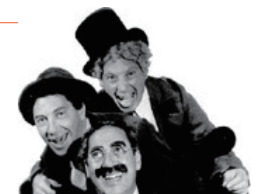
マルクス兄弟。バラエティ番組の元ネタがたくさん。TSUTAYAへGO

オトナ向けプロモーションを手がけています。資料としてオヤジ殺しのコンテンツM×テレビ「DiscoTrain」を立て続けに鑑賞。復活を遂げた「マハラジャ」で 60 年代から現代までのヒット曲を「SoulTrain」のノンストップスタイルで楽しむ番組で、司会は押坂忍の倅で DJ.OSSY こと押坂雅彦と早見優!!。それにしても小泉今日子を筆頭にあの時代の「アイドルスキル」は凄いです。早見優は、ぼくにとっては地元高円寺のスナックみたいなもので、何年ぶりに冷やかしても、ついボトルを入れてしまうエヴァーグリーンな魔力がある?! 閑話休題 押坂が野村克也の名言を引用し、年頭の辞を述べていた。「ちっぽけなプライドは成長の邪魔になる」 うーん、B級 2 世タレントが言うリアルに説得力がある。思い起こせば、ぼくも偉人だけでなく先人たちの言葉にどれほどインスパイアされてきたことか、よし今月はぼくの好きな名言集でいってみよう。ばふばふ。まずは次世代へ、煙たがられるのを承知で捧げます。「阿呆はいつも彼以外のものを阿呆である信じている」(芥川龍之介) 中学生で好きになった作家。因みにその後が吉行淳之介、ぼくの乱読人生がスタートしました。「厄介なのは何も知らないことではない。実際は知らないのに、知っていると思ひ込んでいることだ」(マーク・トウェイン) TDL のアトラクション名でも知られる、ミスターアメリカが文学。ハックルベリー・フィンの作者です。続いて日本をリードする先輩諸氏へ、消極的な平和主義者なもので、つい…。「戦争を美しく語るものを信用するな、彼らは決まって戦場にいなかった者なのだから」(クリント・イーストウッド) 新作「ハドソン川の奇跡」封切りが待ち遠しい… 「世界中の人間が想像力を働かせれば、核兵器なんて一瞬にこの世から消える」(多分大江健三郎) 多分伊坂幸太郎の随筆で見つけたコトバ そして同世代へ、エールを！ 「年をとったから遊ばなくなるのではない。遊ばなくなるから年をとるのだ」(ジョージ・バーナード・ショー) まだまだ遊ぶのだ、それでいいのだ 「20 歳の顔は自然の贈り物。50 歳の顔はあなたの功績」(ココ・シャネル) 年を重ねるのもそんなに悪くないですよ 最後が一番好きのがこれ。チャップリン以前の偉大なコメディチーム、マルクス兄弟のグルーチョ・マルクスの名言(ヒゲダンスの元ネタです) 「私を会員するようなクラブには入りたくない」 ね、最高の自虐ネタでしょ。では次号、Ciao!