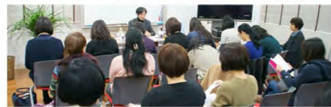
(写真上)「魂が喜ぶアンチエイジング講座」の様子。